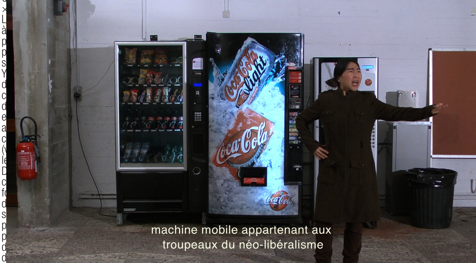
machine mobile appartenant aux troupeaux du néo-libéralisme